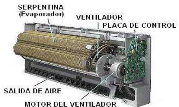
Componentes principales de la unidad interior