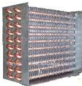
Serpentina construida con tubos aletados

Un intercambiador de calor es un dispositivo diseñado para transferir calor entre dos fluidos, o entre la superficie de un sólido y un fluido en movimiento. Son elementos fundamentales en los sistemas de calefacción, refrigeración, acondicionamiento de aire, producción de energía y procesamiento químico.