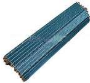
Serpentina de tubo y placas

Volviendo a las serpentinas, estas son un intercambiador de calor ejecutado con tubos, donde circula un fluido en estado líquido o gaseoso y superficies aletadas en vinculación con el aire. En aplicaciones de aire acondicionado se fabrican dos tipos de serpentinas: con tubos aletados o con tubos y placas. En la mayoría de los equipos autocontenidos para aplicaciones residenciales se usa serpentinas con tubo y placa.