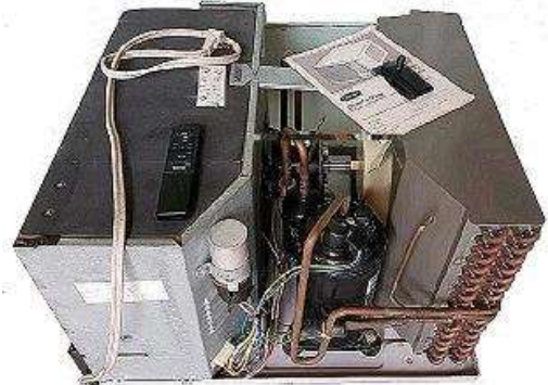
Equipo acondicionador sin gabinete