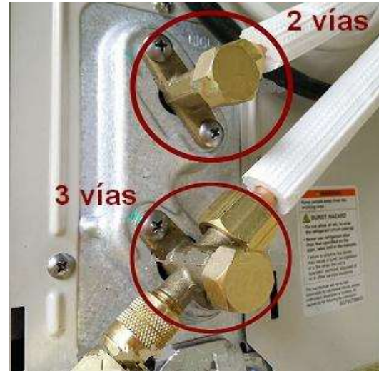
Válvulas de servicio - 2 y 3 vías