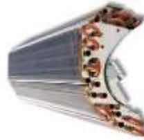
Serpentina de una unidad interior