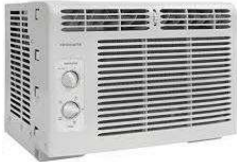
Equipo acondicionador de ventana

En estos equipos todos los componentes están ubicados en un solo gabinete. Los chasis de estos equipos tienen dos secciones definidas, en la parte interior está ubicada la serpentina evaporadora, el ventilador de recirculación del aire tratado, las rejillas de retorno, el deflector de salida de aire, el filtro y el panel de control. En el sector exterior se ubica la serpentina condensadora, el ventilador de recirculación de aire exterior, el compresor, el dispositivo de expansión y la válvula inversora de ciclo. Las figuras siguientes muestran la ubicación de los distintos componentes.