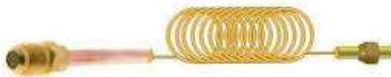
Tubo capilar usado en refrigeración como dispositivo de expansión