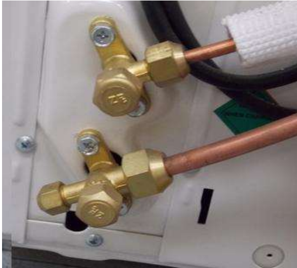
Válvulas de servicio.

Permiten mantener completamente aislada la unidad exterior mientras se efectúan las tareas de montaje. Hay una válvula de dos vías en la línea de líquido y una de tres vías en la línea de gas la que es utilizada para hacer vacío, introducir el volumen de refrigerante adicional o para verificar las presiones del circuito de refrigeración.