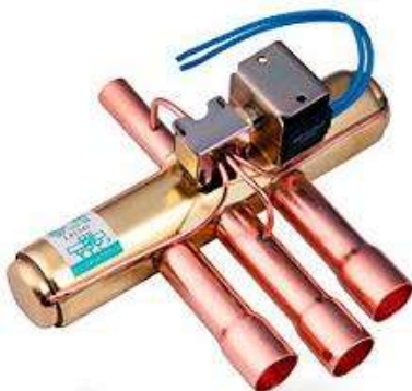
Válvula inversora de ciclo

No obstante que hay muchos fabricantes de válvulas del tipo corredera, su construcción básica y el funcionamiento es el mismo.