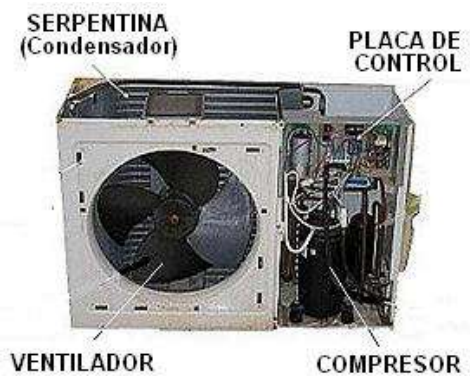
Unidad exterior sin gabinete