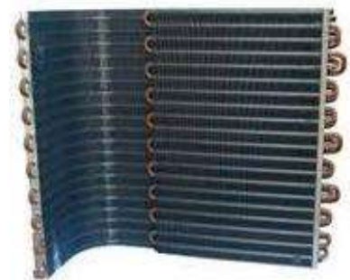
Serpentina de una unidad condensadora exterior

Entonces las serpentinas en aplicaciones de aire acondicionado tienen dos superficies de contacto; una es el área del interior de los tubos por donde circula el refrigerante y la otra son las aletas por donde pasa el aire.