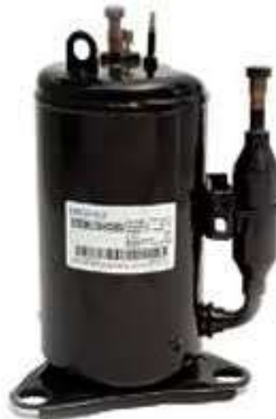
Característico compresor de un equipo "Split"

Los compresores abiertos utilizados en instalaciones de aire acondicionado son más versátiles y accesibles se utilizan en sistemas de capacidad media y grande, al ser totalmente accesibles su reparación se simplifica. El motor al no estar en contacto con el refrigerante es enfriado en forma convencional.